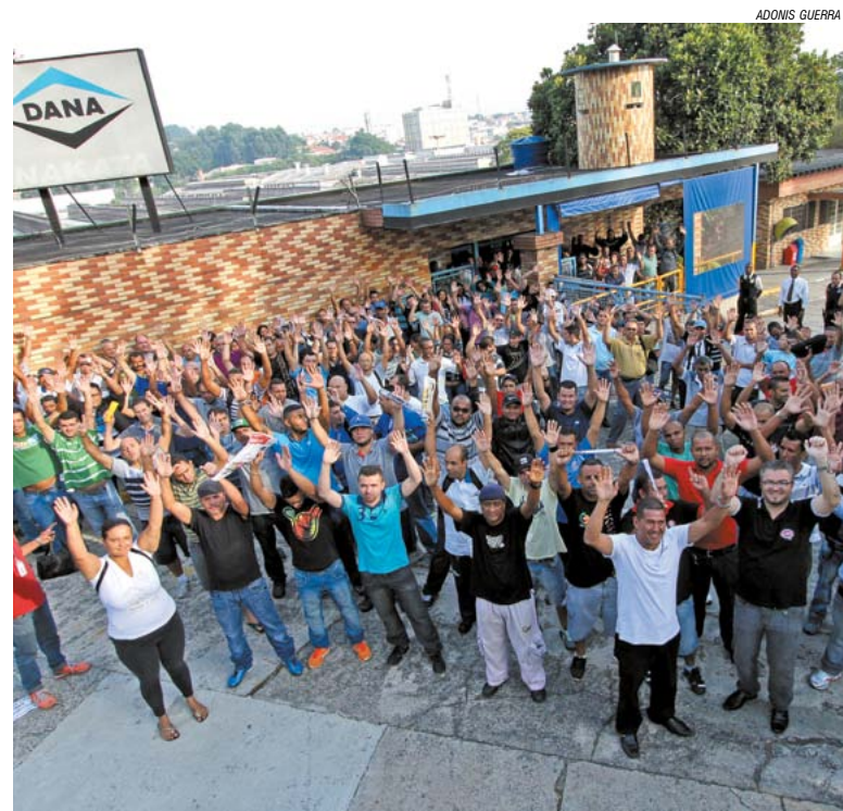
Trabalhadores nas três fábricas aprovam disposição de luta

Os trabalhadores na Affinia, Dana e nos três turnos na Melling, em Diadema, param por duas horas na manhã da última quinta-feira, dia 5, em protesto contra a demissão de duas companheiras na Melling com restrições médicas.